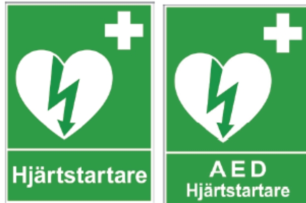
Figur 1— Exempel på skyltar enligt HLR-rådet

Hänvisningsskylt(ar) ska finnas i den utsträckning som motiveras av lokalers storlek och avstånd till hjärtstartaren.